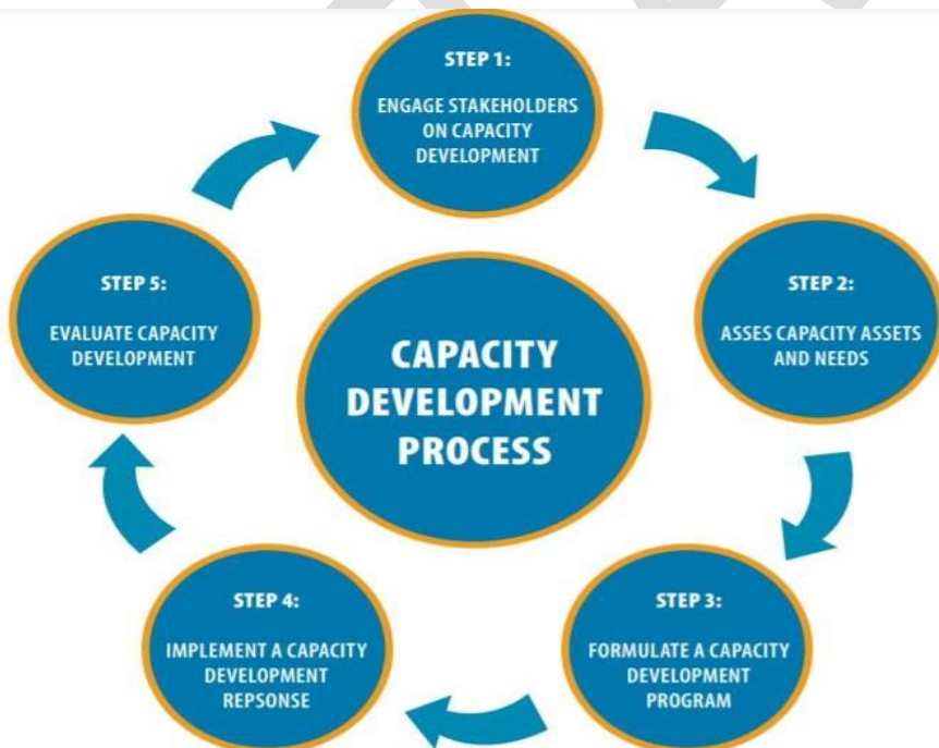
Gambar 4. Proses Pembangunan Kapasitas Kelembagaan, UNDP(2008)

UNDP mengintegrasikan sistem peningkatan kapasitas ini ke dalam pekerjaannya untuk mencapai Tujuan Pembangunan Milenium (MDGs). Ini berfokus pada pembangunan kapasitas di tingkat kelembagaan karena percaya bahwa "lembaga adalah jantung dari pembangunan manusia, dan bahwa ketika mereka mampu bekerja lebih baik, mempertahankan kinerja itu dari waktu ke waktu, dan mengelola 'kejutan' pada sistem, mereka dapat memberikan kontribusi yang lebih berarti bagi pencapaian tujuan pembangunan manusia nasional". Berikut adalah proses pembangunan kapasitas menurut UNDP.